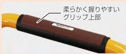
柔らかく握りやすいグリップ上部